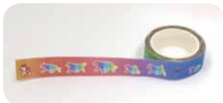
JKC オリジナルマスキングテープ