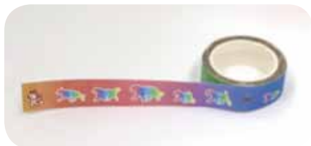
JKC オリジナルマスキングテープ